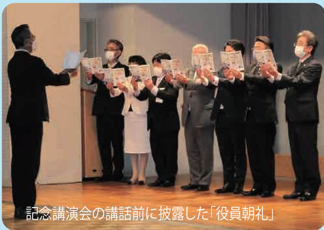
記念講演会の講話前に披露した「役員朝礼」