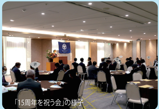
「15周年を祝う会」の様子