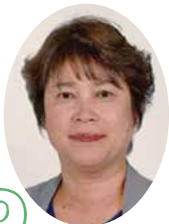
天童市倫理法人会会長

現在普及拡大に関しましては、さまざまな課題がありますが、歴代会長の想いを受け継ぎ、苦難福門と前向きに捉え実践して参ります。