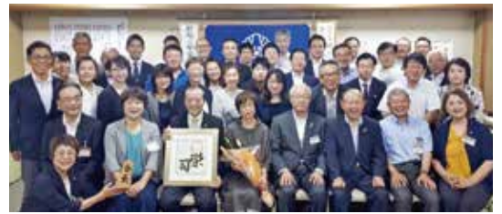
3年間ありがとうございました!

ややもすると、計算しながら生きることが習慣になっている時代において、童の心を共有できる方々との出会いは、人生の宝物です。そして、ここ天童こそ『天与童心』学びの場所にふさわしい土地であると思います。