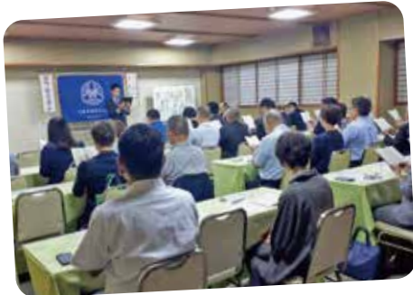
万人幸福の葉を輪読。