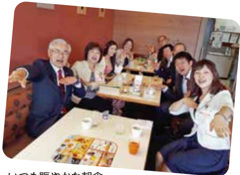
いつも賑やかな朝食。