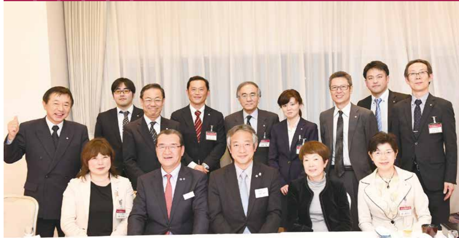
平成30年4月24日倫理経営講演会にて