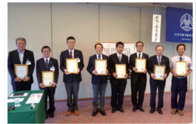
(株)吉田段ボール/アライ花店/(株)たくみ/(株)でん六/(株)横澤製作所 ヘアサロン梅津/(株)中村勝義建築事務所/(有)板垣商店

ヘアサロン梅津さんは、なんと7年連続の皆出席。次いで(株)横澤製作所さんは6年連続、(有)板垣商店さんが5年連続、(株)中村勝義建築事務所は2年連続です。社員の方だけでなく何人でも出席できるMSなので、ぜひ皆さんもチャレンジしてください。