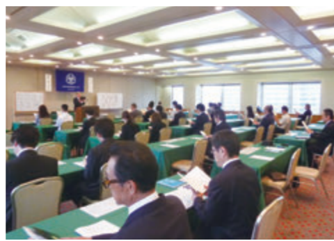
モーニングセミナーの様子

参加者の多さもそうですが、基本的に忠実に、それでいて参加して下さる皆さんが心地よく過ごせるよう、もてなしの心と笑顔を頑張っている蔵王です。