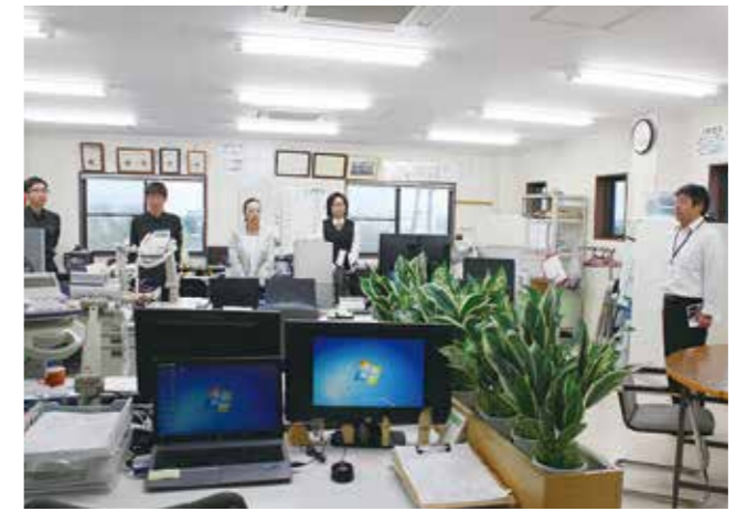
どを各自述べながら、一日が有意義な日となる朝礼をめざしています。

当社には全社員で約八〇名いるのですが、勤務先が散在していることと、夜勤者も多いので全員での朝礼ができませんが、本社ではモデル朝礼をやり、その他、出先ではできるだけモデル朝礼に近いかたちで行うように心掛けています。「職場の教養」を輪読した後、本日の業務注意点な