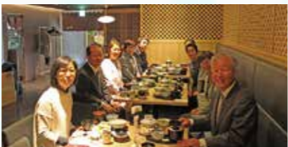
AM7:30~ 朝食会 終了後、講師の方を囲んで朝食を頂きながら情報交換をしております。皆さんもぜひ一緒にませんか?