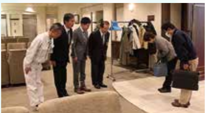
AM6:10~ セミナー受付 会員の皆様を役員一同でお迎えしています。出席カードへのスタンプ押印にて、会員同士競い合っつて出席しています。