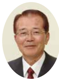
米沢市倫理法人会 会長