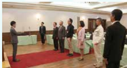
AM6:00~ 役員朝礼 挨拶の練習や、スローガン斉唱を行っています。※役員でない方も是非ご参加ください。