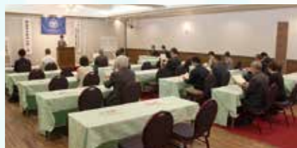
AM6:30~ モーニングセミナー 万人幸福の菜を輪読して、講師をお招きしての講演をお聞きます!