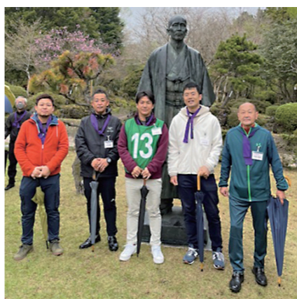
富士研での仲間たち

特別講演では、素晴らしい貴重なお話も聞きましたし、富士山を眺めて、外でのワークでは自然と一体になり、地球の声を澄ますような時間も沢山設けてあり、今思い返せば、心の深い部分に記憶が刻まれたかの様です。