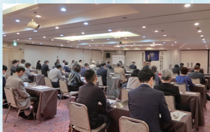
モーニングセミナー