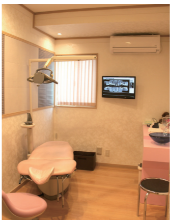
メインテナンスルーム

6年後の一九八三年後半、治療から予防重視の予防歯科医療の構築に向けて、一気に診療体制を変えました。覚悟はしていましたが、収入が減少し、経済的に苦しい時期を過ごすことになりました。更に、歯科医院の総合力を高めるために努力を続ける必要もあり、スタッフ教育、自身の知識や技術の習得のため、勉強会への参加など、