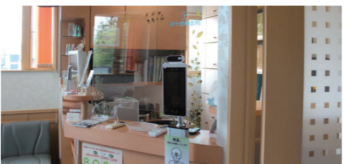
メインテナンスルーム

いただき、今年一月に第50回山形県医療功労賞（読売新聞社主催）の栄誉を賜りました。 予防医学が重要視される昨今、0歳児歯科検診から高齢者の在宅医療までシームレスな取り組みを行い、多職種チーム連携の下、今後も口の健康から市民の健康寿命の延伸に貢献したいと思っています。