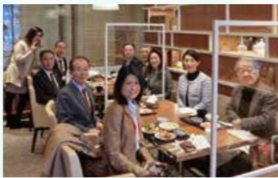
朝食会 1F レストラン L'atelier 空 (Kuu)

毎週木曜日 会場/米沢エクセルホテル東急 米沢市中央1丁目13-3 電話：0238-24-0411