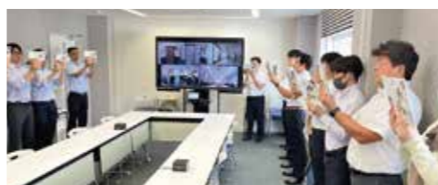
オンラインによる朝礼の様子

どんな朝礼をしていますか？ IT企業では珍しいのですが、朝礼前に駐車場に集合しラジオ体操をやり、その後会議室に移動し、山形本社、米沢支店、庄内支店、郡山支店の四か所をオンラインでつなぎモニターで映し出しながら毎朝合同で朝礼を行っています。 各部から昨日の報告、当日の予定など発表してもらい、その後「職場の教養」を当番が読みますが、読後の感想は当番が指名しますので、皆、真剣に職場の教養を読み、いつ当てられなくても良いように気構え指名されたら感想を述べます。