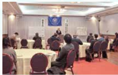
モーニングセミナー 2F ミュージックホール