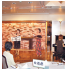
音楽と夕べ ビールを醸成して ワインに 山形市倫理法人会、女性委員会

今回ご協賛いただきました方々・お手伝いいただきました方々・参加された方々多くの皆様に感謝して報告をさせていただきます。ありがとうございます。