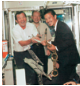
貸切列車 フラワー長井線 『倫理法人号』 長井市倫理法人会

県内唯一の第三セクターによる山形鉄道株式会社に対して、貸切イベント列車を計画し地域貢献事業として支援するため、長井市倫理法人会が主管して、山形県倫理法人会の後援を得て、去る八月二十五日フラワー長井線に、二両編成の特別貸切列車『倫理法人号』を赤湯・荒砥間に二往復運行いたしました。 米沢市・山形市・天童市・寒河江市・上市市の各法人会の倫友と、長井市・置賜総合支庁の来賓の参加も得て合計七十五名の参加で、車窓の風景・寿司・焼き鳥・飲み物等をごちそうに宴会を楽しみました。その間、荒砥駅での白鷹町商工会による地元名物お菓子・地酒の販売、鮎貝地区「四季の郷」区画整理組合のPRパンフレット配布、列車格納庫内でのビクターレコード水木杏香ショー、列車内及び赤湯駅でホームでのアンサンブルエザルタートによる演奏等を楽しみました。参加された会員の皆様は、倫友と飲み語らい時間を忘れてあつという間の六時間でした。長井市倫理法人会としても、このように努力している山形鉄道株式会社に、地域貢献事業として今後とも継続的にイベント列車を貸切して支援していきたいと思えます。来年もまた同じ頃、生