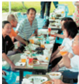
第2回家族芋煮会 のご報告 寒河江市倫理法人会

ビール片手に山形県倫理法人会員の参加をいただき盛大に開催したいと思えますので、絶大なるご支援をどうぞよろしくお願いいたします。ありがとうございます。