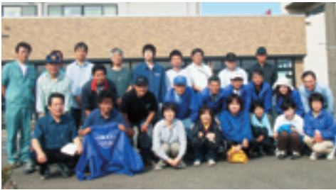
▲地域清掃が終わって