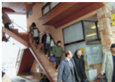
雨模様の中バスで出発