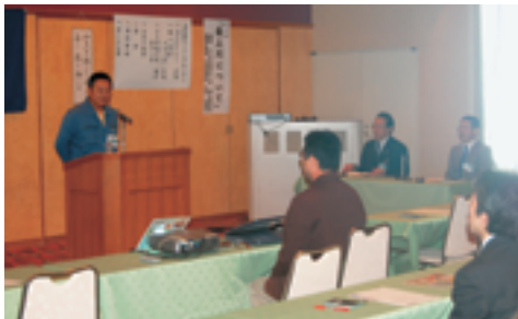
最上川について学んだMS

本年五月二十六日の設立二周年を期に会報「かみのやま」を年四回発刊します。全会員のマインド力の向上と活動内容を上市市民の方々に広く知ってもらおうことが目的です。MSについては、三十社四十名出席を活力