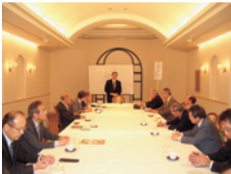
新会場となったホテルメトロポリタン山形にてES

また、ブナ文化フォーラムは原点回帰し小国で開催します。大自然のブナ林散策、新鮮な山菜料理と地酒、他にも色々な楽しいイベントを考えていますので、倫友の皆様多数のご参加をお待ちしています。そして「良いことは人にすすめよう」を合言葉に目標に向かって普及に邁進していきましょう。普及こそ新しい人生の扉を開く鍵であると思信じて。「日本創生」は、「二人一社紹介」の小さい地道な活動からやがて、日本を動かすことが出来るでしょう。