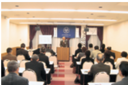
家族で出席される姿もあるMS

月日の経つのは早いもので、昨年の五月九日に長井市倫理法人会が設立されてから、まもなく一周年を迎えようとしています。この間、「見るもの」、「聞くこと」、諸々全てが「初めてのことばかり」で、多くのみなさんに色々とお世話になりましたことを深く感謝申し上げます。スタートしたてで慣れないことづくしで、ずいぶんご迷惑をおかけしたのではないかと思います。切に内容赦くださいますようお願い申し上げます。今年度後半戦に向けましては、単会として、更なる充実した組織づくりを目指し、そして会員の倫理意識の高揚と倫理観を身に付けた生き方を目標に先ずは実践を