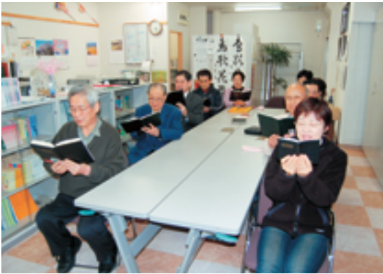
おはよう倫理塾(毎朝、午前5時から事務局で開催中)

『家庭倫理の会山形』は現在山形中央、鶴岡、鶴岡南、酒田、新庄、南陽、寒河江、上山の八支部を倫理普及の拠点として創生三年を迎える今年度は『家庭をよくし、地域をよくし、日本をよくする』と