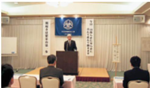
米沢のまちづくりをテーマのMSの様子

最大のイベントと捕らえて現在活動を行つている。倫理講演会当日は、非会員へ我々の倫理活動を理解して頂く絶好の機会である。