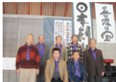
富士高原研修所にて

参加前の気持ち (加) 当初は立場上の参加。(原) 徳福一致の倫理の中味を理解したい。(高) 風邪を気力で克服しての参加。(小) 初参加の不安。学んだこと (加) 体はわがものに非ず、先祖代々の御霊が躍動する宝器、宝具なり。(原) 見えなものの大切さを知った。(高) あいさつ・姿勢・後始末のやり方、大切さとやる意味、元気な返事と、妻、父母に感謝の気持ちで接するようになった。(小) 日常生活の総点検をする機会となり、普段からの様々な事柄の大切さを実感。 決意表明 (加) 減量し65kgを到達体重とする。(原) 仏壇・墓参り・明朗・愛和・喜働の実践、まず家庭の中から。(高) 父母・祖先・妻への感謝の念を深め出会う人々への奉仕に全力を尽くす、「全責任は我にあり」と覚悟し真正面から対応し、人材育成は適材適所の職場作りを実践。(小) 自分から元気に挨拶、早起きの実践、嫌な事から始める。 現在どのように実践されているか (加) 毎朝体重測定し記録、摂生を実践中。(原) 仏壇・墓参り・家庭でのあいさつ実践。(高) あいさつと仏前のお参りを実践、他人のせいにならず対応、会社も目的達成し感謝(小) 挨拶の実践、早起きは毎朝五時五分起床に挑戦中、苦難は幸福の門として努力中。 今回の参加意志 (全員) 参加したい。