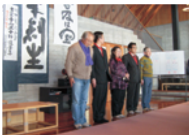
緊張感が伝わります