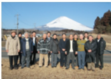
富士山を背に記念撮影