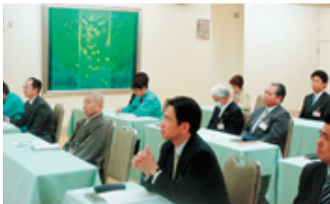
真剣なまなざしで講師の話の聞く

天童市倫理法人会は準備で発足し、一年目で一〇〇社達成により、正倫理法人会として設立し本年で八年目になります。その間、会運営に最も熱心であった副会長が二人、それに常任幹事が続けて亡くなるなど、かなりのアクシ