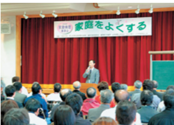
会場は満員、家庭倫理講演会の様子

法人会様には昨年度は一千社を見事に達成、今年度は余勢をかつて一二〇〇社達成、も間近のことと、一日も早い目標達成を御祈念申しあげますと共に家庭倫理の会山形への変わらざるご厚情を宜しくお願い致します。