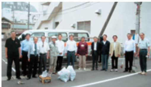
会員のみなさんで早朝清掃を行いました

平成二十年度下期は特に慢心を戒め、年度当初に「蔵王 理念と方針」に掲げたとおり、①山形市蔵王倫理法人会は「日本創生」を目標とす、②会員企業の倫理経営を応援しよう、③日本一質の高いMSを実現しよう、④喜働を実践し、人を励ませよう、⑤家族に感謝しよう、⑥朝礼を充実させよう、⑦企業経営と蔵王経営を一对の反射鏡としよう、⑧実践してまいりませう、⑨ご指導ご鞭撻の程お願い申し上げます。