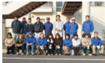
早朝清掃を終えて

以前より倫理経営を実践し、頼りになる方々ですから、目標未達などある筈がないと、「会長の私は泰然自若」の心境で過ご