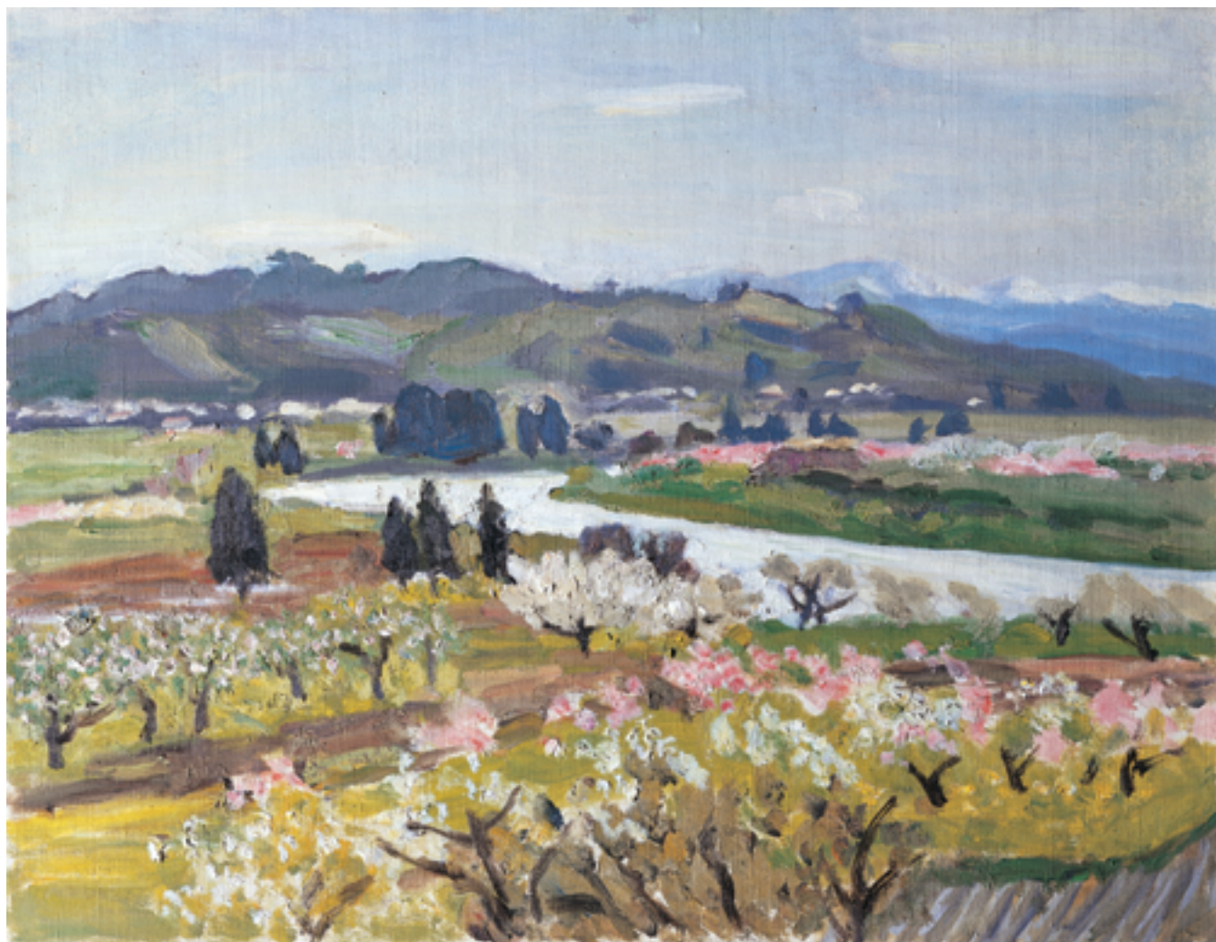
真下慶治「春（寒河江）」1990年制作 50号 真下慶治記念美術館 蔵