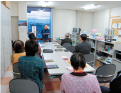
なごやかな家庭、健康第一、家庭、夫婦円満

いう家庭倫理の会の目的を明確に意識づけ、地域密着、地域貢献型の活動を組織的に展開すると共に「学ぶ」「拡げる」「役立つ」、三本柱とした組織活動の基盤づくりを強力に推し進め、会員相互の連帯感の輪を拡げ、地域における倫理運動の拠点である支部活動を積極的に展開しております。家庭倫理の会は全国で一七〇カ所、おはよう倫理塾(一年三六五日、早朝五時から)の勉強会)の開催は三五〇の会場にて毎日行なわれています。昭和二十四年四月一日創始者の自宅にて早朝講座(朝の集い)が始まり、その後、全国に拡がり現在のおはよう倫理塾となりました。家庭倫理の会山形の本年度の事業としては講演会を二会場で行い