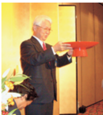
本当にグイッと飲み干された熊谷相談役