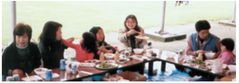
やっぱり、芋煮は野外がいい。