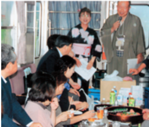
景色も最高。歌もご馳走も言うことなし。

県内唯一の第三セクター山形鉄道株式会社が運営しているフラワー長井線への地域貢献事業として、長井市倫理法人会が主管し山形県倫理法人会の後援を得て、去る八月二十三日(土)第二回特別貸切列車「倫理法人会」を赤湯・荒砥間二往復運行いたしました。