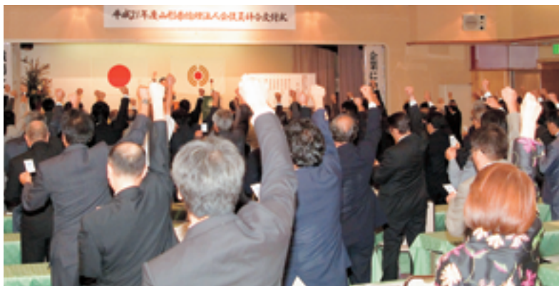
普及拡大 やるぞ！ やるぞ！ やるぞ！