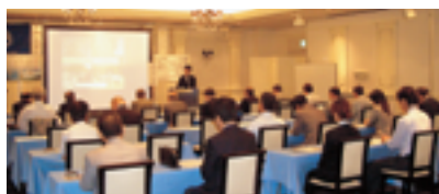
プロジェクトを使った説明