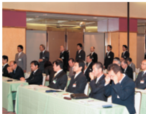
ひとりずつ手渡される辞令、緊張感が漂う