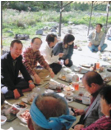
山形の秋は美味しいいも煮です。

そんな中ご夫婦限定で、旦那様から奥様へ感謝の言葉と花束をプレゼントするサプライズが用意されました。パートナーへ感謝の気持ちを伝える素晴らしい企画が行われ、その場にいた皆様が心温まる想いを感じたに違いありません。今回、朝早くから準備された皆様に感謝申し上げます。