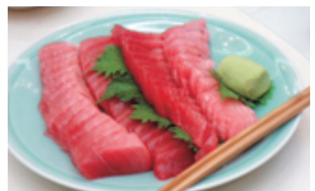
鮭の美味しさが伝わりますか

滝の湯ホテル特製の「あつ!アツ!熱!」の特製芋煮。懐かしいみそおにぎり付きでお代わり自由。大盛況の「秋の芋煮と鮭づくし大顔合わせ会」でした。