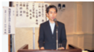
上山市副市長 榎口豊氏