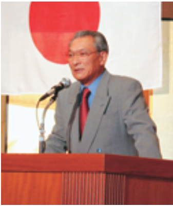
小野木氏による「夢！挑戦！行動！」と題した講演

講演の中では率直・素直な話にうなずき、さわめき有り、少年老い易く、企業成り難し、人生八〇