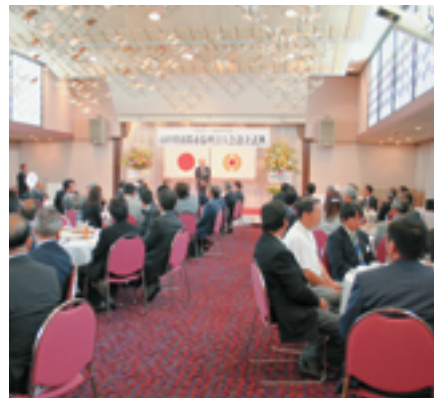
県内単会から多くの方が参加されました