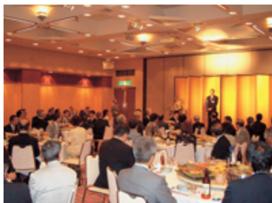
県内各単会のみなさんと交流を深めました