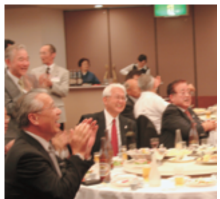
楽しい懇親会の様子