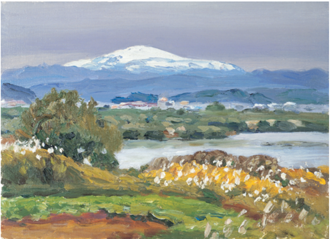
真下慶治「秋の河畔」1982年制作 5号