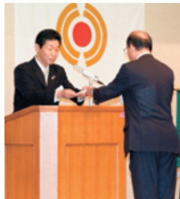
藤崎方面長から辞令拝受