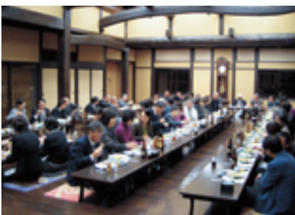
美味しいお酒と食事を堪能