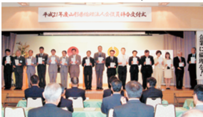
役職者の責任感がズシリ