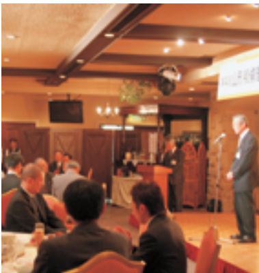
懇親会は盛り上がり交流の輪が広がりました