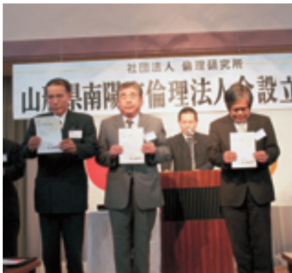
辞令が役員の方に手渡されました