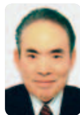
庄内中央倫理法人会