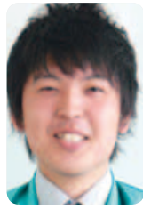
新庄最上倫理法人会