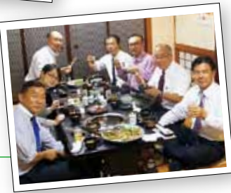
幹事研修会後の懇親会。山形牛に舌鼓。

倫理法人会を知らない企業や必要としている企業や人々が大勢います。今年度も設立の初心忘れること無く「なれあいではない優しさ、責め心のない厳しさ」を合言葉に、明るく楽しく倫理を実践。 目指せ「明朗」日本一 “を真っ青な行動旗に誓いたいと思います。