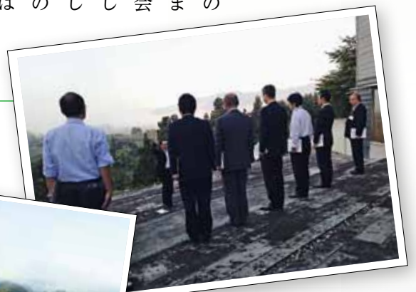
真下記念美術館でMS。凜とした空気にいつもより背筋が伸びます。