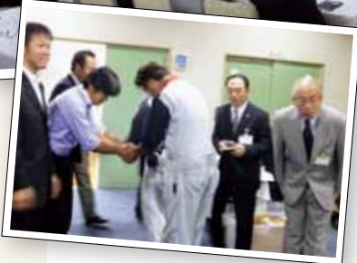
10月からは会場がたびやかた嵐湯からクアハウス基点に変わりました。