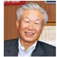
■ えがおの人 山形県倫理法人会監査役 米沢市倫理法人会相談役