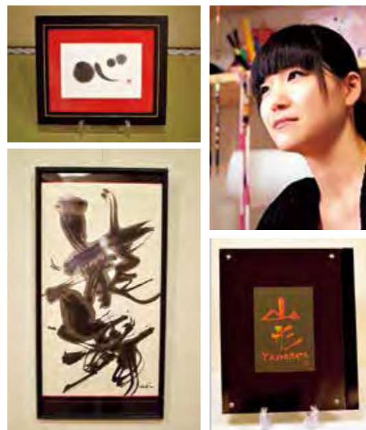
未来さんは、県内のイベントや店舗看板を始め、テレビや映画のタイトル等も手がけられています。

講話の内容で何よりも驚かされたのは、未来さんの行動力でした。未来さんは当初から、映画の題字をしてみたいと思っていたそうです。そのために映画のエキストラに応募し、少ないチャンスの中プロデューサーに名刺を渡し、後日連絡が入り、願いがかなったそうです。これは講師の日頃の思いと、チャンスをつかむための