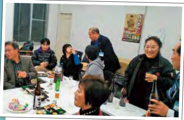
懇親会も盛り上がりました!

準備段階から、たくさんの方々よりご参加、ご協力を頂き誠にありがとうございました。