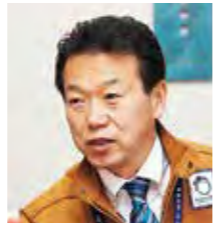
■ えがおの人 山形市中央倫理法人会 副会長