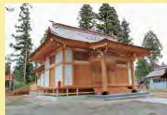
事例_柏倉八幡神社