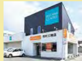
リフォームショップ