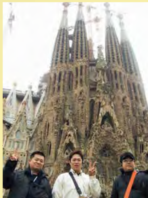
海外研修旅行 (H27年度)

「思っている。」と話すことがあります。「こうすればよかった」と後悔することが必要なことで、後悔があるから進歩があると思うんです。最高のものって、永遠にできているわけではないものなのかもしれませぬ。