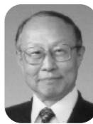
山形県倫理法人会 研修委員長