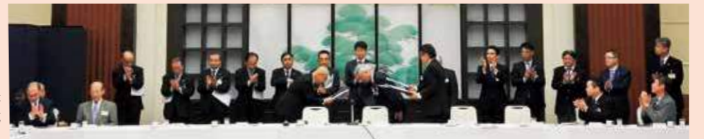
山形県歴代会長 バッジ授与式 (11/7)

法人局からも、揺るぎない七万社を達成する事ができ、目標とする10万社への大きな足掛かりになったと報告がありました。さらにこの2月からは、全国600箇所を超える会場で「大転換の時代〜つねに活路あり〜」のテーマで倫理経営講演会も開催されます。山形県内でも15箇所で開催されますので、会員の皆様は是非お近くの会場におかけください。