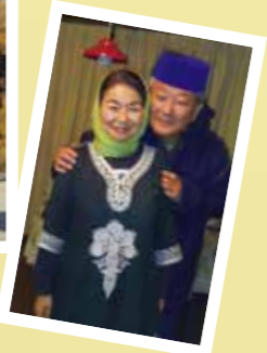
チケットや宿を自力で手配しながら、ウズベキスタン、ジョージアと、夫婦でシルクロードを西にたどる旅。