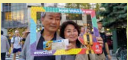
家族でW杯ラグビー3試合を観戦に出かけすっかりラグビーファンに。そのきっかけで社名誕生。