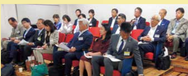
昨年の富士研修100日後実践報告会

いただいております、富士研（富士高原研修所での研修）一〇〇日後実践報告会にも参加してきました。とても充実した時間でしたし、いろんなところに芽（よい結果）が出て、それが会員間につながっていかればと思っております。ただ、倫理法人会は女性が少なかった会ということもあり、「女性の視点で考えるところおかしいのでは？」と思うこともしばしばあります。男性社会では気づかなかったことに、気づいてもらうきっかけになるよう提案していければと考えています。