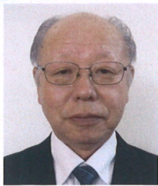
南陽市倫理法人会