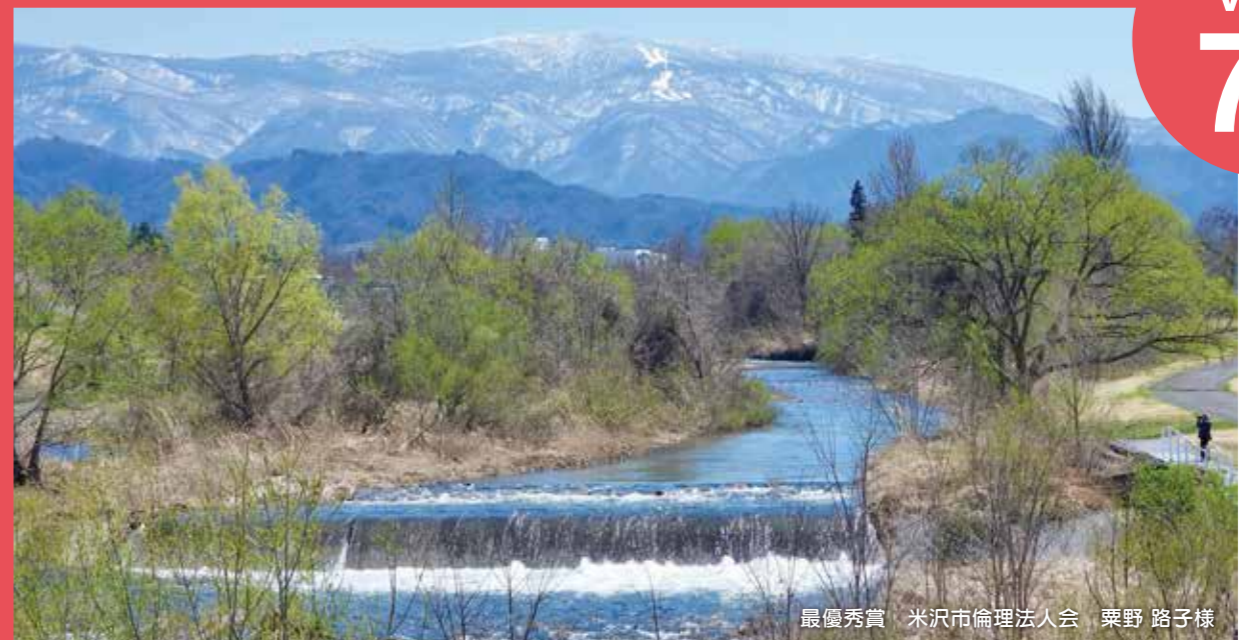
最優秀賞 米沢市倫理法人会 粟野 路子様